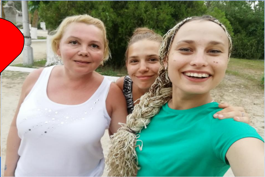
Я и мои напарницы