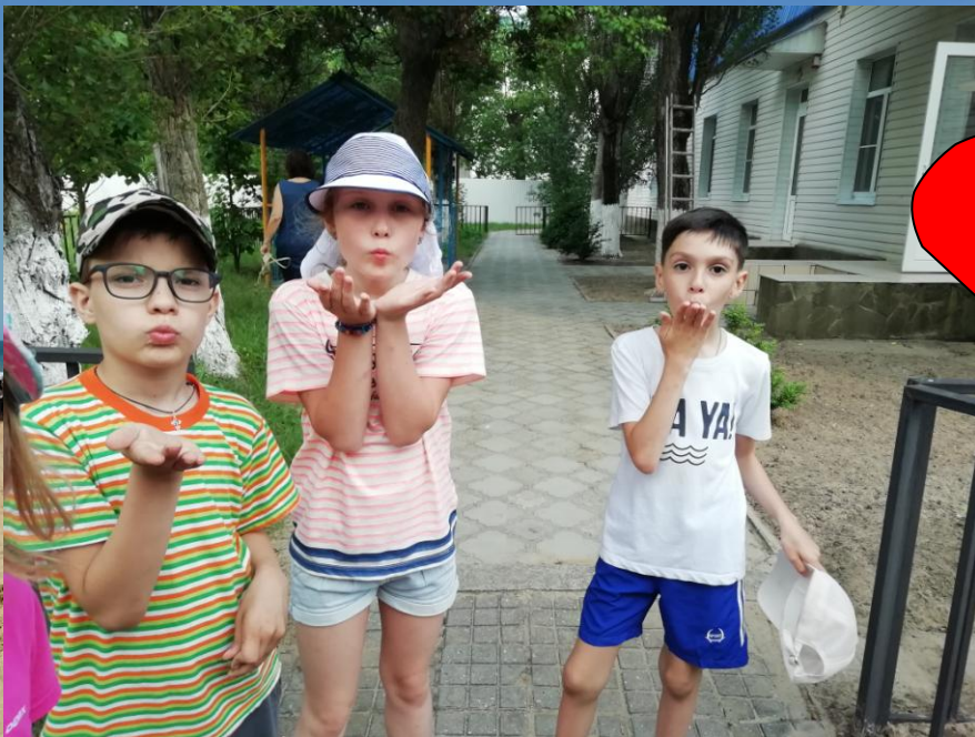
Воздушный приветик от 8го отряда)))