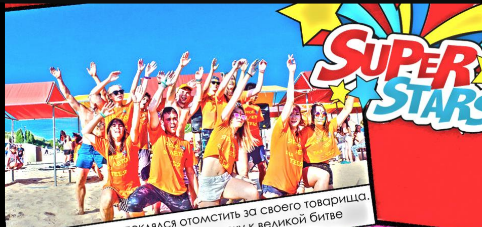
Оранжевый Орден поклялся отомстить за своего товарища. Вожатское братство начало подготовку к великой битве