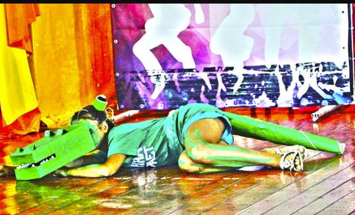
До Зло - не вожатый в пять утра. Оно не дремлет. Пока герои мчали на выручку к Черному морю, Гадкий Алекс выпустил своего приспешника - Крокодила с Картонной Головой.