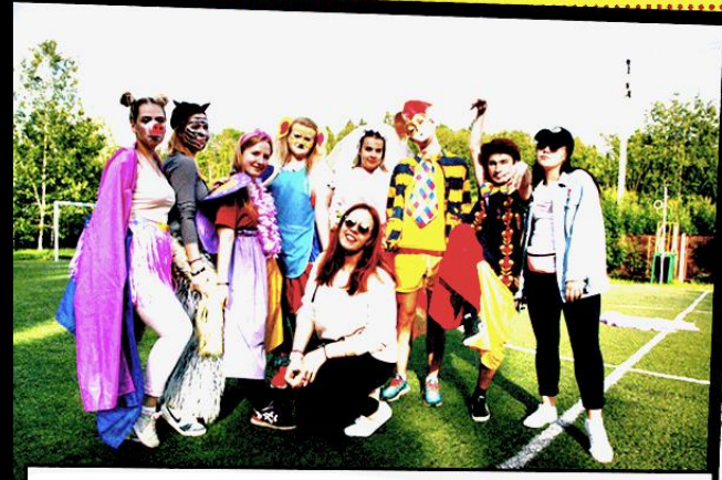
Первыми, прямым из сафари пришли на помощь сборная быстрого реагирования ЮО