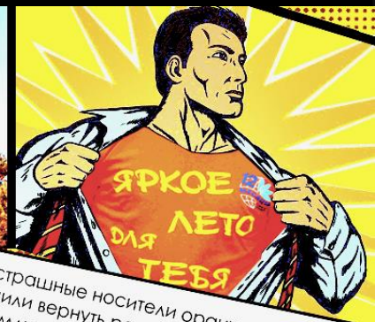
Бесстрашные носители оранжевых футболок решили вернуть радость и покой на землю детства. Но сначала они решили усилить свое братство и послали за подмогой в подмосковный "Юный Строитель" и лагерь "Петрушка" тревожные стикеры.