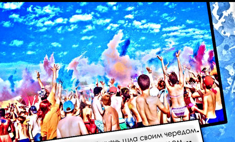
В детском лагере "Волна" жизнь шла своим чередом. Каждый день был наполнен радостью и весельем...