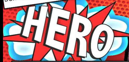
Не остались в стороне и дети. С письменным разрешением от родителей они вставали под знамена "12 месяцев"