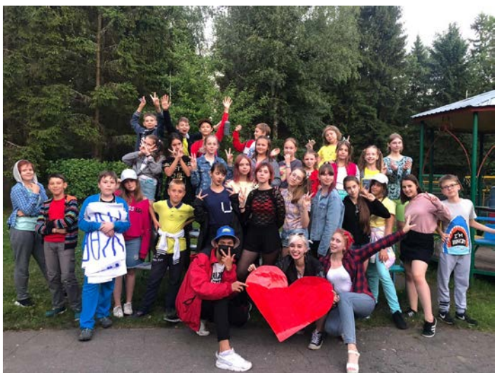
Отмечаем 1 место в "Битве хоров"