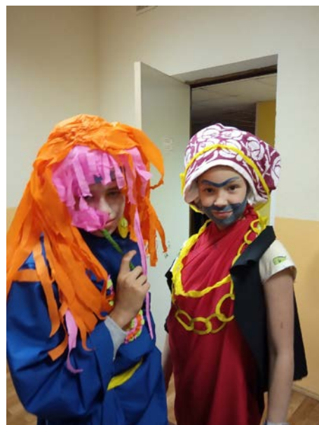
Послы из Турции, 21 век.

ЛЮБОВЬ - ВОТ ЧТО ГЛАВНОЕ В НАШЕЙ РАБОТЕ. ЛЮБОВЬ К ДЕТЯМ И КАЖДОМУ ДНЮ, ПРОВЕДЁННОМУ В ЛАГЕРЕ - ВОТ, ЧТО ЗАСТАВЛЯЕТ ТЕБЯ ВСТАВАТЬ ПОСЛЕ ТАКОГО КОРОТКОГО СНА.